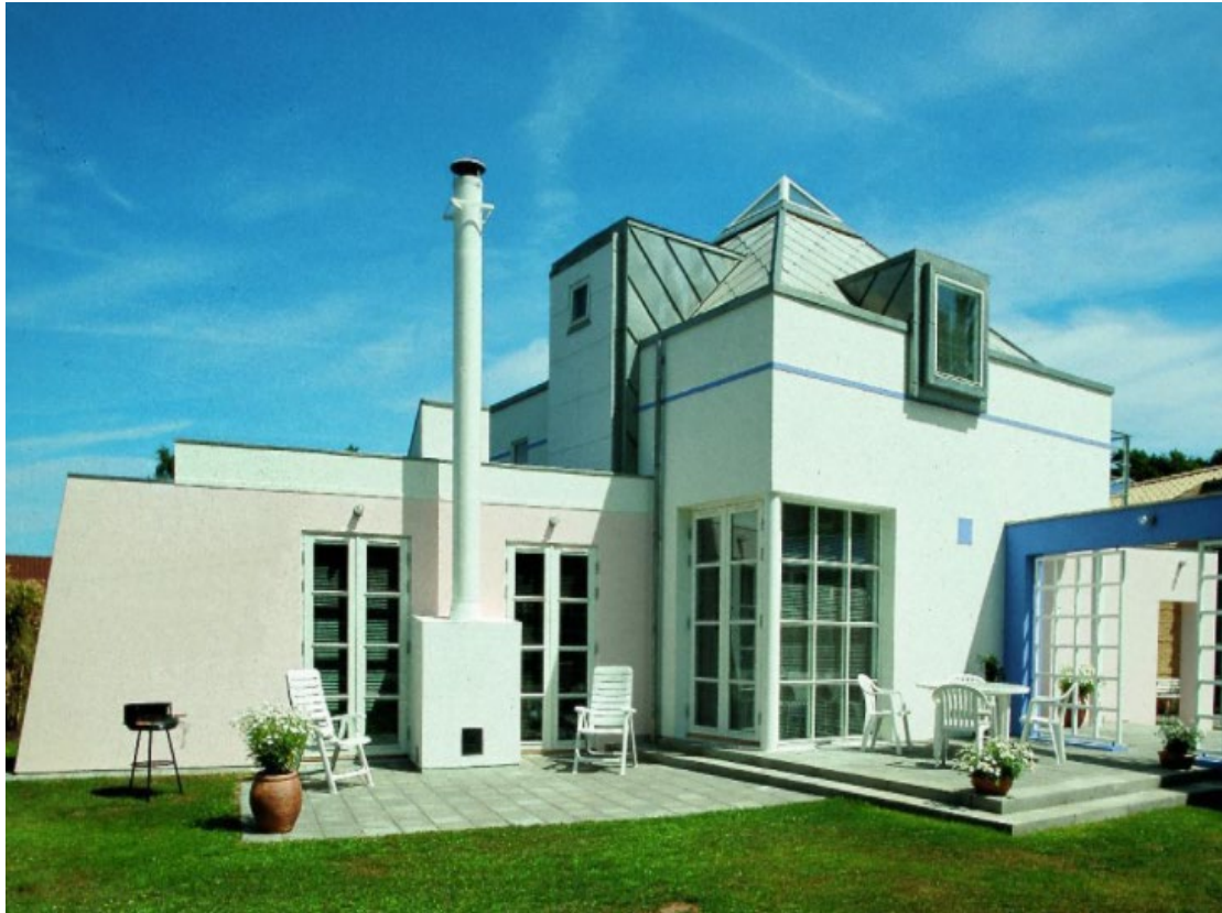
Hus af 3 x Nielsen